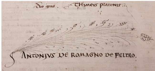
Figure 1 MS Marcianus L.Z. 469 (= 1856), fol. 14v, explicit of the Latin translation of the Timaeus , with mention of Antonius de Romagno de Feltro. Venice, Biblioteca Nazionale Marciana.

The manuscript Venice, Biblioteca Nazionale Marciana, L.Z. 469 (= 1856), marked by the siglum M 1 , belongs to the library's oldest collection, that of Bessarion. 1 It is a miscellaneous codex in terms of both contents and hands: it contains Calcidius' Latin translation of Plato's Timaeus along with his commentary (fols 2r-14v + 16r-58r), a brief extract from Cicero's De natura deorum I (fols 58v-59v), Apuleius' Apologia (fols 63r-95r), and Macrobius' Saturnalia (fols 99r-142v). 2