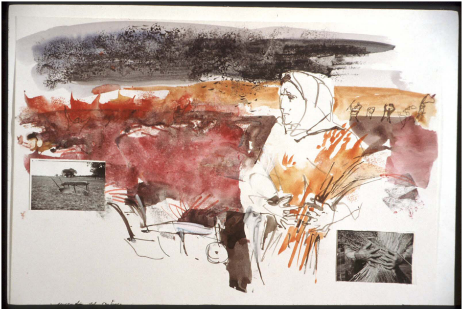
Fig. 3. Juan Carlos Castagnino, La nona Maria, la primera cosecha, las langostas . Gouaches, tinta y collages. 70x50 cm. Roma, 1966.

no conocí, furlano, molinero y anárquico, que en 1880 tuvo que emigrar por hambre y política de Santa Maria la Longa en el Friuli, a la pampa argentina».