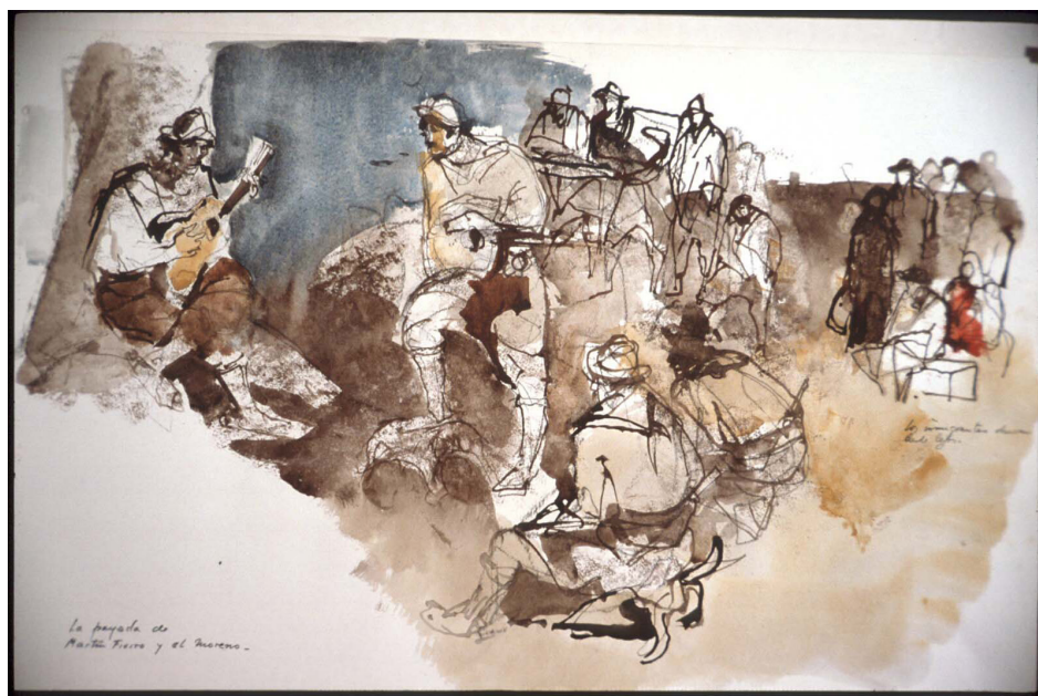
Fig. 4. Juan Carlos Castagnino, Payada de Martín Fierro con el Negro y los inmigrantes . Gouaches, tinta y collages. 70x50 cm. Roma, 1966.

do...» y un tango enlaza los dos mundos del cineasta con el dolor de la diáspora y del tiempo irrecuperable, mientras el molino Birri, en su estado actual de abandono, y la placa de la «Località Casoli-Birri» certifican el origen y las razones de la huida.