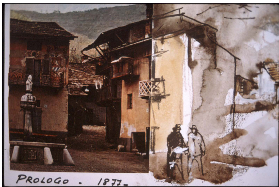
Foto 2. Juan Carlos Castagnino, San Lupo, los anarquistas utópicos . Gouaches, tinta y collages. 70x50 cm. Roma, 1966.

canto all'avventura, al lavoro, al frumento ed all'orizzonte. Un canto, infine, alla conquista del nostro pane e della nostra utopia quotidiana.