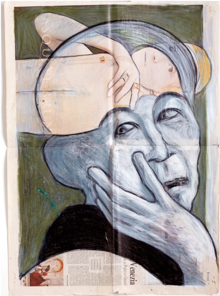
Fig. 2. Hannah Arendt. Pasquale Bruni - «Corriere della Sera», 29 aprile 2006.

della pallida modella, testimone per la pubblicità dei gioielli di Pasquale Bruni; lei, testimone invece di chi fu spogliato di tutto. Hannah Arendt, privata anche dei suoi diritti civili (fig. 2).