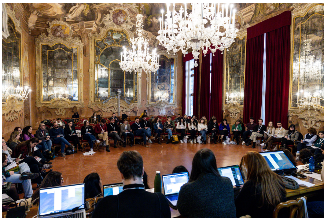
Un momento della sessione plenaria conclusiva dei Tavoli di lavoro under 35