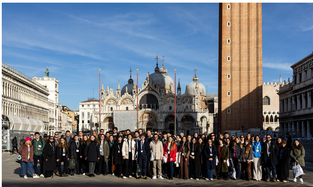
La foto di gruppo dei partecipanti ai Tavoli di lavoro under 35 durante la sessione «Venezia itinerante» in Piazza San Marco