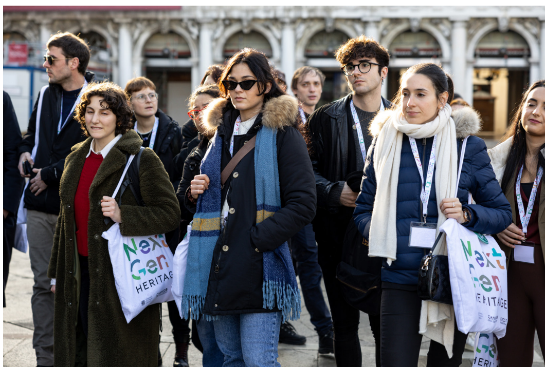
Alcuni partecipanti ai Tavoli di lavoro under 35 durante la sessione «Venezia itinerante»