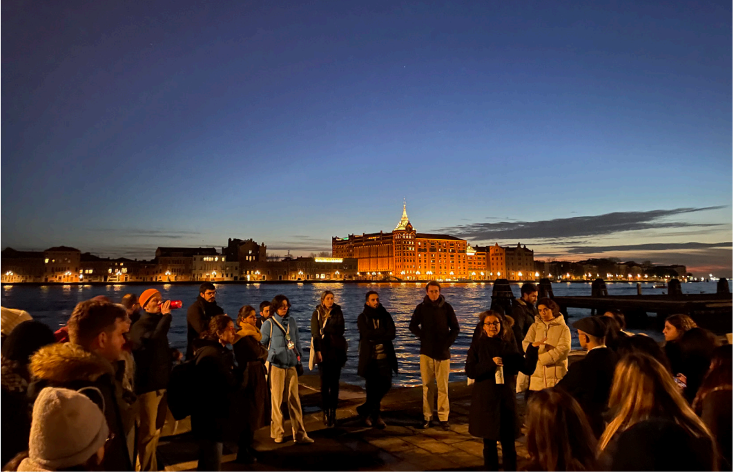
I partecipanti ai Tavoli di lavoro under 35 durante la sessione «Venezia itinerante»

Ha affermato che quelle voci contano e devono essere protagoniste della fruizione e gestione dei beni culturali. Ha chiarito cioè che i beni culturali – oggetti e luoghi – non sono importanti di per sé, ma per i significati e gli usi che le persone attribuiscono loro e per i valori che rappresentano. È un’idea forte, diffusa in molte società civili europee: Faro ha inteso che anche i beni culturali sono beni pubblici ed elemento distintivo della democrazia e dei diritti umani. Faro è perciò un punto di non ritorno. Definitivo.