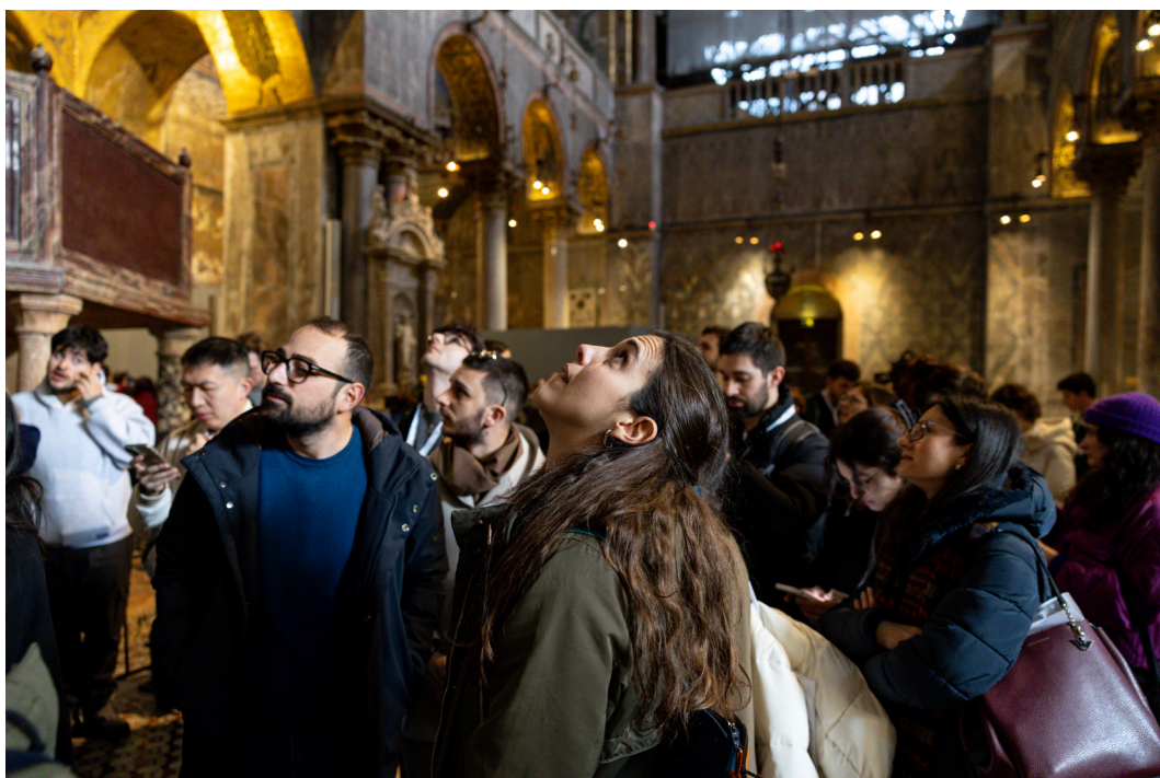
Alcuni partecipanti ai Tavoli di lavoro under 35 durante la visita alla Basilica di San Marco realizzata per la sessione «Venezia itinerante»

Durante quel primo workshop, abbiamo ospitato allo stesso Tavolo donne afgane, del Camerun, della Siria, dell'Egitto e di altre nazionalità. Abbiamo fatto una cosa molto importante: abbiamo riso tantissimo, facendo attività con ritratti e utilizzando l'arte come un meta-linguaggio. Siamo riuscite a conoscerci, e anche a creare dei momenti di benessere tra di noi. Abbiamo condotto molti altri workshop, dopo questo: in particolare la seconda mostra, che è stata poi la conclusione del progetto, e si è intitolata The Women are Present , un omaggio alla performance di Marina Abramović. Questo titolo era rappresentato anche nell'opera di string art , realizzata su una tavola di legno molto grande che le artiste hanno realizzato. Ad oggi quelle donne, molte, non sono più lì, e sicuramente adesso non si potrebbero mai immaginare che la loro storia è raccontata di fronte a così tante persone. Però sappiamo che le nuove donne che arrivano oggi nel campo, forse vedendo queste opere, e vedendo che le donne lì sono presenti, hanno un po' meno paura.