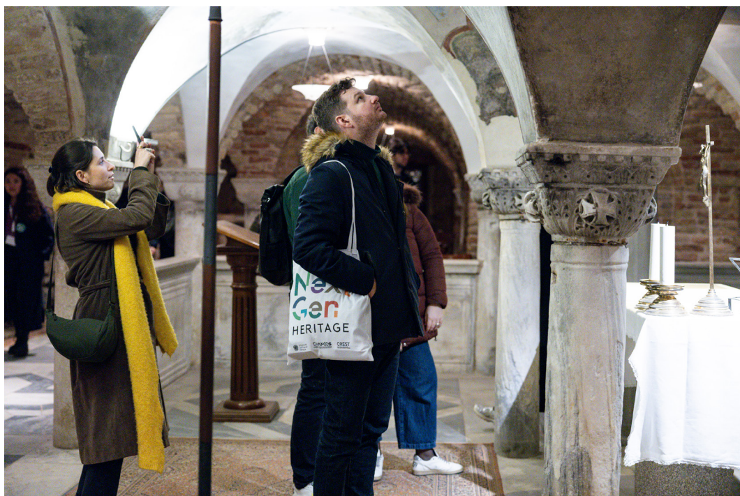
Alcuni partecipanti ai Tavoli di lavoro under 35 durante la visita alla cripta della Basilica di San Marco organizzata per la sessione «Venezia itinerante»