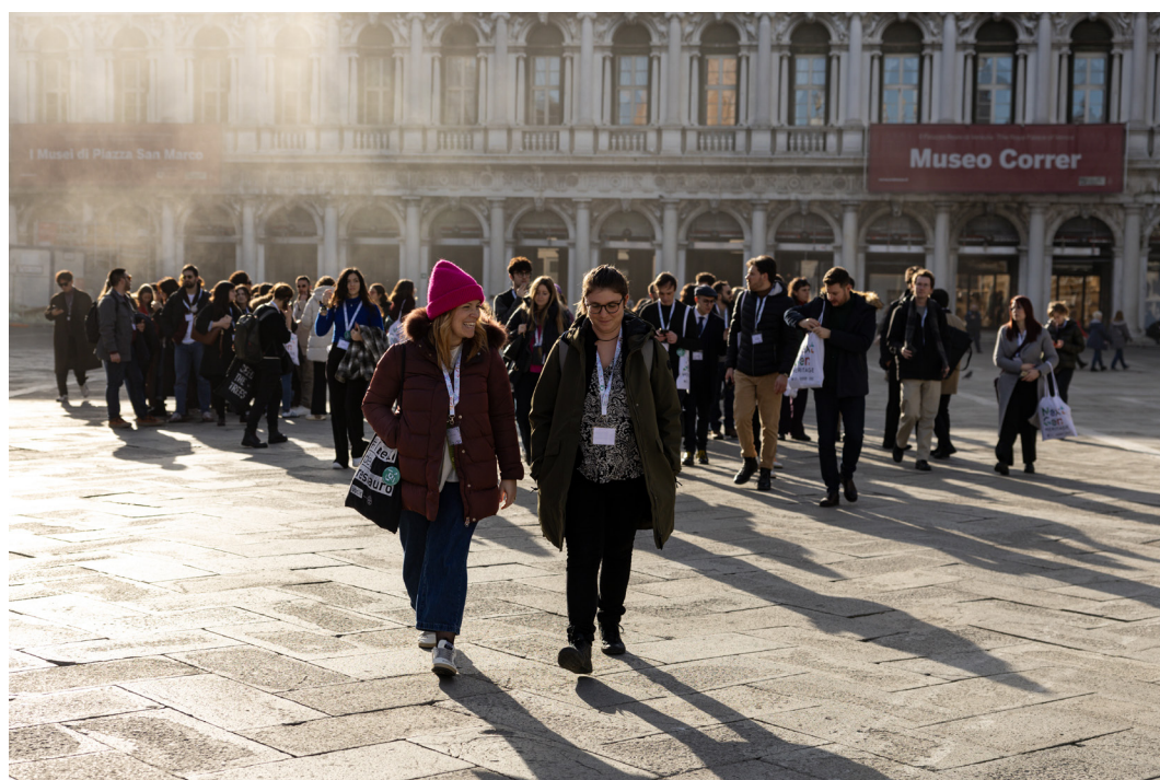
Alcuni partecipanti ai Tavoli di lavoro under 35 durante la sessione «Venezia itinerante»