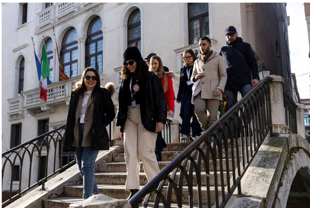
Alcuni partecipanti ai Tavoli di lavoro under 35 durante la sessione «Venezia itinerante»