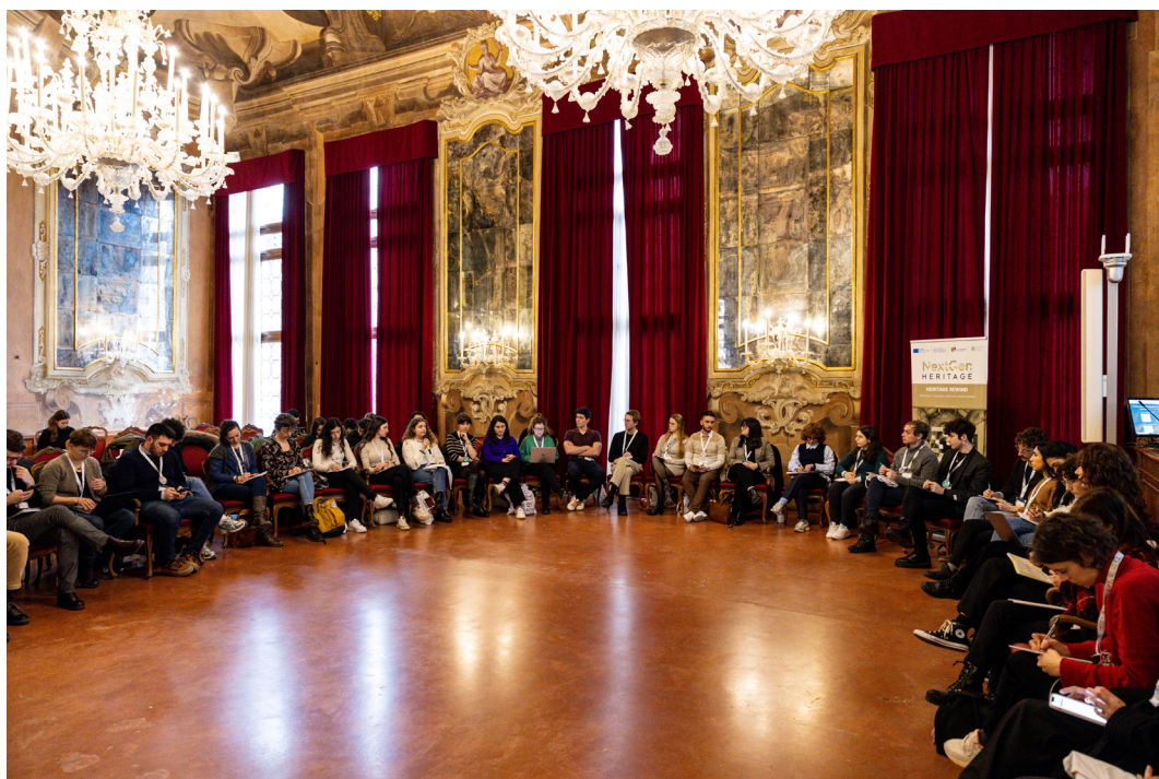
La sessione plenaria conclusiva dei Tavoli di lavoro under 35

Io una domanda più che altro come metodo. Noi ora presenteremo questi concetti primari come ovviamente delle tematiche su cui pensare la riorganizzazione del Codice, ma lasceremo a loro facoltà di espanderli dal punto di vista della loro interpretazione o gli forniremo un documento di supporto che li espande secondo quello che è uscito fuori da questo Tavolo?