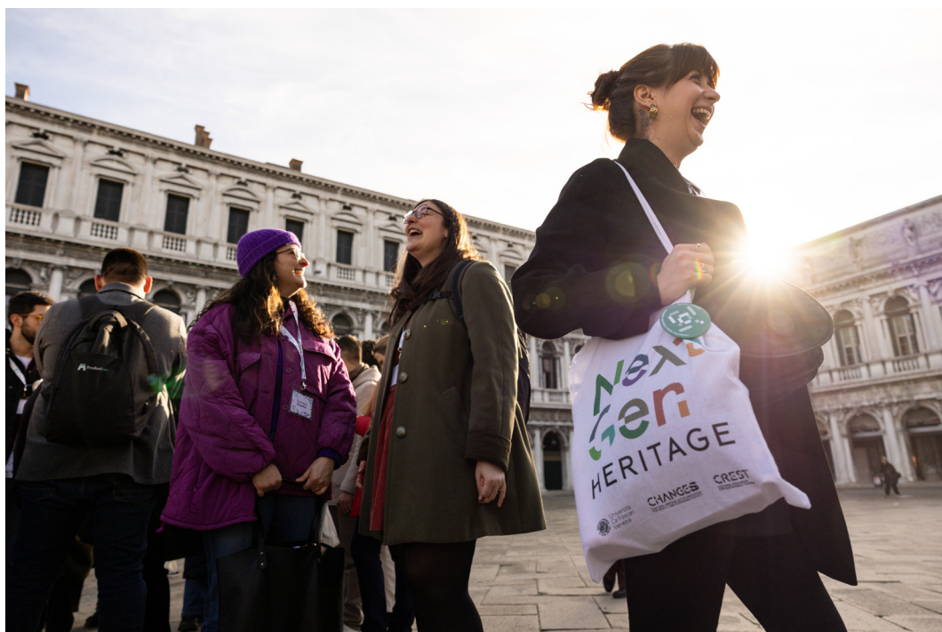
Un momento della sessione «Venezia itinerante»