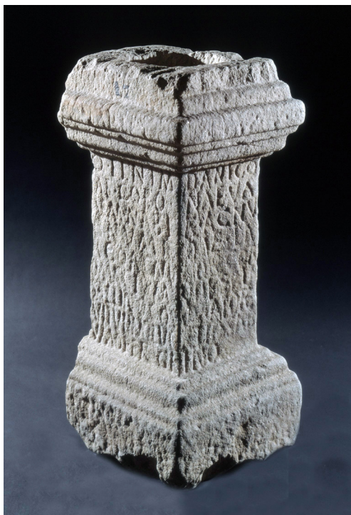
Figura 2 Altar de Marecos, Penafiel

homenajeaban a las divinidades que las patrocinaban, todas ellas con fecha posterior a los idus del mes. Tenemos, así, las Cerealia , las Vinalia priora y las Robigalia , vinculadas al ritmo de producción agrícola, y las Fordicidia y las Parilia , todas ellas de tradición pastoril. También es un período coincidente con los festejos romanos en honor de la Magna Mater , a la que posiblemente se refiere esta inscripción como Ida . 9 Estos festejos conmemorativos de la llegada de la diosa a Roma y de la dedicación de su santuario, incluían sacrificios, juegos ( ludi Megalenses ) y banquetes, que tenían lugar entre el 4 y el 10 de abril.