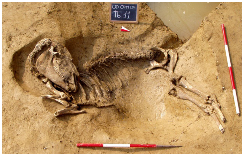
Figura 3 Oderzo, necropoli dell'Opera Pia Moro 2005, il cavallo della tomba 11 (foto di scavo)

una particolare affezione al gruppo cui apparteneva, un'altra probabilmente è l'interpretazione che si può dare per il cavallo della tomba 11. Nonostante la sepoltura fosse troncata alla sommità da interventi agrari moderni che hanno reso difficile il riconoscimento dei rapporti stratigrafici, è possibile formulare alcune ipotesi interpretative sulla base della posizione topografica del cavallo e dell'analisi delle strutture funerarie circostanti, alla luce anche dei contesti di confronto presentati sopra. Il cavallo della tomba 11 era deposto all'interno di una fossa orientata NW-SE scavata su US 67, livello di frequentazione esteso in tutta l'area necropolare, e ubicata tra il tumulo I e il tumulo V, due strutture funerarie che occupano il settore occidentale della necropoli (fig. 4). Entrambi i tumuli si sviluppano al di sopra di due sepolture preesistenti (tbb. 65, 67), datate rispettivamente all'ultimo quarto del VI sec. a.C. e tra la metà del VI e l'inizio del V sec. a.C. Il tumulo V, il più antico, accoglie due sepolture distanziate tra loro cronologicamente: la prima (tb. 73) si data alla metà del V sec. a.C. mentre la seconda (tb. 7) alla seconda metà del II sec. a.C. Il tumulo I rappresenta invece il complesso più articolato di tutta la necropoli e anche quello di più recente attivazione, caratterizzato da almeno