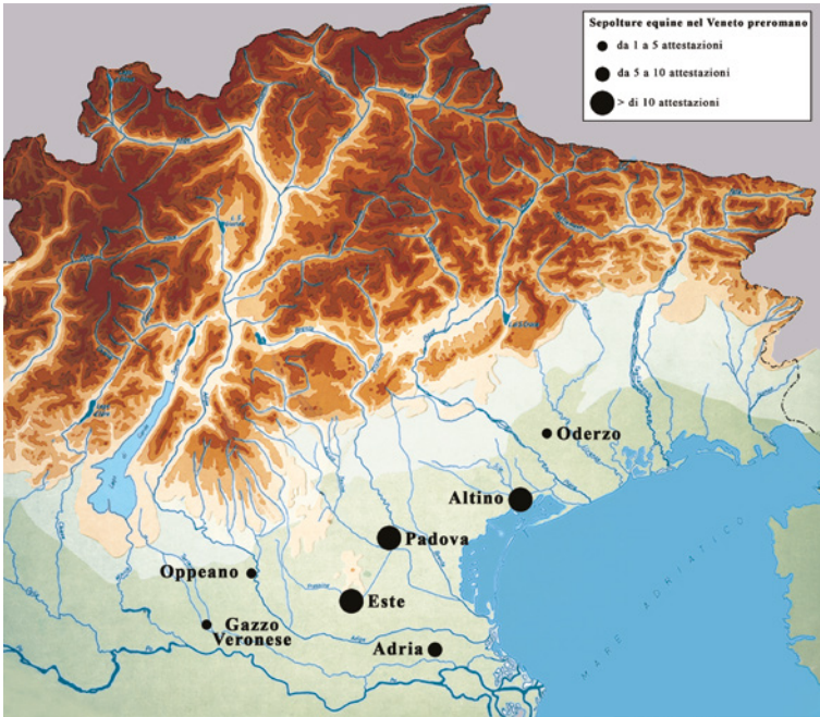
Figura 1 Distribuzione delle sepolture equine nel Veneto preromano (elaborazione F. Bortolami)

quali veniva eseguito il sacrificio, finalità dello stesso, ruolo e valore del cavallo sacrificato ecc., a testimonianza di come questa pratica variasse in relazione alle scelte rituali della comunità e alle diverse occasioni in cui veniva compiuta.