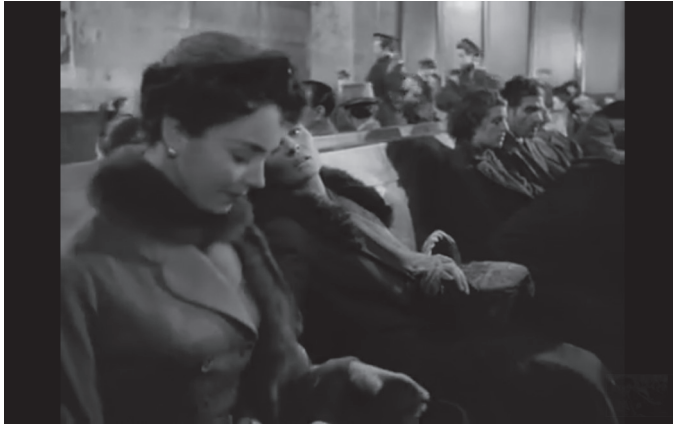
Figura 2.2 Inquadratura tratta da Stazione Termini di Vittorio de Sica (1953). Mary si siede accanto ad una donna che non si sente bene

dall'Inghilterra dove aveva cercato invano di trovare lavoro. La sala d'aspetto della terza classe è caratterizzata dalla presenza, sullo sfondo, di ombre gigantesche dei tram che passano fuori dalla stazione. Queste ombre inquietanti potrebbero suggerire un'intrusione del mondo esterno all'interno dell'ambiente chiuso della stazione, oppure potrebbero essere viste come il riflesso sia delle preoccupazioni di Mary per la sua vita sentimentale sia delle preoccupazioni della donna siciliana per la sua gravidanza. Mary aiuta la donna, sottolineando così che le sue azioni sono mosse dai suoi sentimenti piuttosto che dalle regole della società borghese, le quali scoraggerebbero l'interazione tra persone di classi diverse.