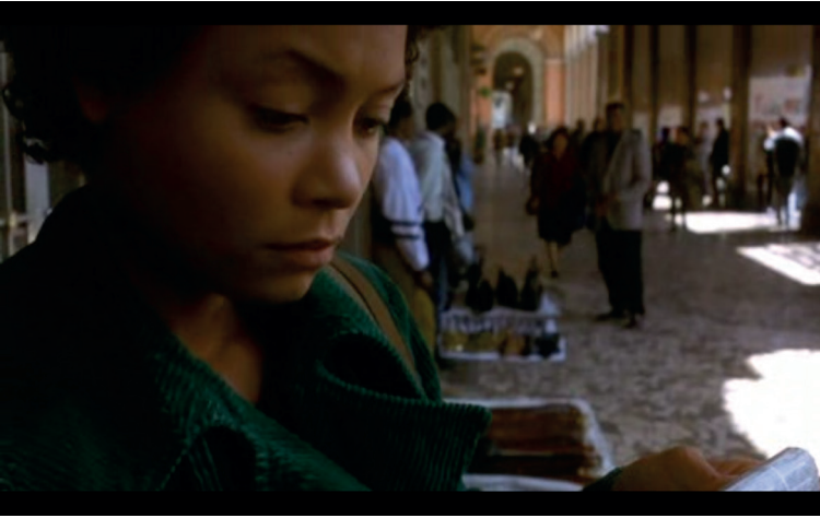
Figura 2.7 Inquadratura tratta da L'assedio di Bernardo Bertolucci (1998). Shandurai (Thandie Newton) sfugge alle indesiderate attenzioni di Jason Kinski (David Thewlis) rifugiandosi a Piazza Vittorio Emanuele II, un luogo così diverso nella sua composizione sociale dai pressi di Piazza di Spagna in cui è ambientata la maggior parte del film