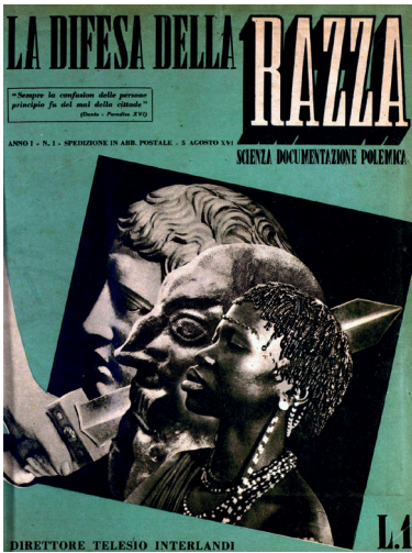
Figura 7.1 La copertina del primo numero della rivista La difesa della razza (1938).