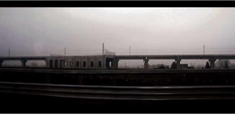
Figura 6.2 Inquadratura tratta dal film Talien di Elia Moutamid (2018). L'edificazione della Pianura Padana

mostra come il razzismo ciclicamente identifichi nuovi gruppi da discriminare come i meridionali negli anni Ottanta e Novanta e gli immigrati in tempi più recenti. Il razzismo non è presente solo all'interno dell'Italia, ma anche in Marocco, nei confronti degli italiani all'estero e nei confronti degli immigrati in Italia, che vengono identificati in termini dispregiativi utilizzando proprio l'aggettivo 'marocchini', indipendentemente dalla loro nazione di provenienza. Mentre il problema della disoccupazione, del precariato e dello stress per le condizioni lavorative che questi lavori comportano è comune a tanti altri uomini e donne della generazione di trentenni di cui fa parte Elia, la sua testimonianza ci parla di una difficoltà ulteriore, vale a dire quella di non trovare lavoro per via di un nome o di un cognome non italiano.