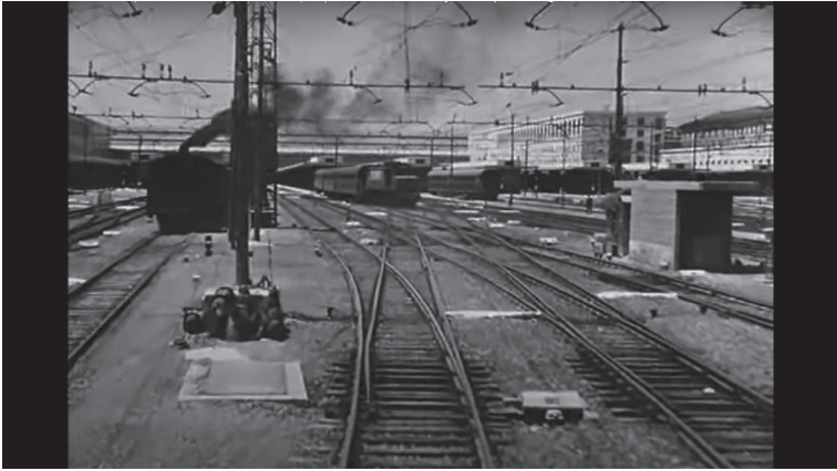
Figura 2.3 Inquadratura tratta da Il cammino della speranza di Pietro Germi (1953). Un fumo nero accoglie gli emigrati in viaggio per la Francia, a simboleggiare i contrattempi che incontreranno in questa tappa del loro viaggio