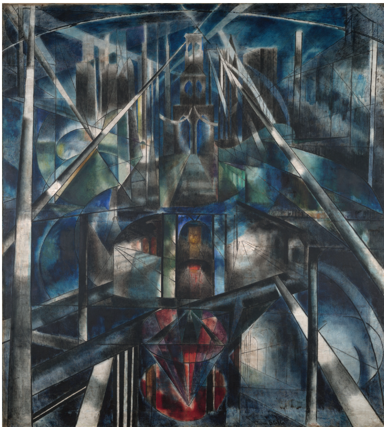
Figura 1.1 Joseph Stella, Brooklyn Bridge (1919-20). Olio su tela, 215,3 × 194,6 cm.

Brooklyn rappresentato in queste opere potrebbe essere visto non solo come un dipinto capace di cogliere «the spiritual dimensions of urban industrial experience inhered in its visual materiality» (le dimensioni spirituali dell'esperienza industriale urbana ereditate dalla sua materialità visiva) (Ferraro 2005, 44), ma anche di assurgere ad una delle funzioni principali delle cattedrali: quella di ricordare e pregare per i defunti, in questo caso le numerose vite spese per la sua costruzione. Secondo questa lettura, le tonalità scure nel dipinto sarebbero state utilizzate per mostrare la continua minaccia di morte a cui i lavoratori sarebbero sottoposti, nonché per dipingere il ponte come un simbolo del passaggio tra la vita e la morte.