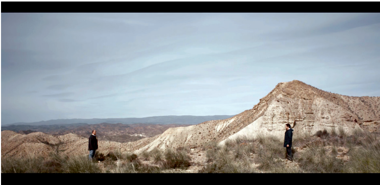
Figura 6.4 Inquadratura tratta dal film Talien di Elia Moutamid (2018). Il confronto tra i due protagonisti immaginato come un film western

genere del road movie che parlano di immigrazione utilizzando un linguaggio cinematografico. A differenza di un film come Easy Rider che – pur rigettando l'estetica del cinema narrativo classico – utilizza il tema del viaggio per costruire «a utopian fantasy of homogeneity and national coherence» (una fantasia utopica di omogeneità e coerenza nazionale) (Cohan, Hark 1997, 3), Talien decostruisce la nazione attraverso il viaggio. Quando Elia si lascia alle spalle l'Italia non segnala solo un processo fisico di allontanamento, ma anche un distacco metaforico sia in termini di pubblico (i possibili spettatori di questo film non sono solo italiani) sia in termini di appartenenza ad un'idea tradizionale di italianità.