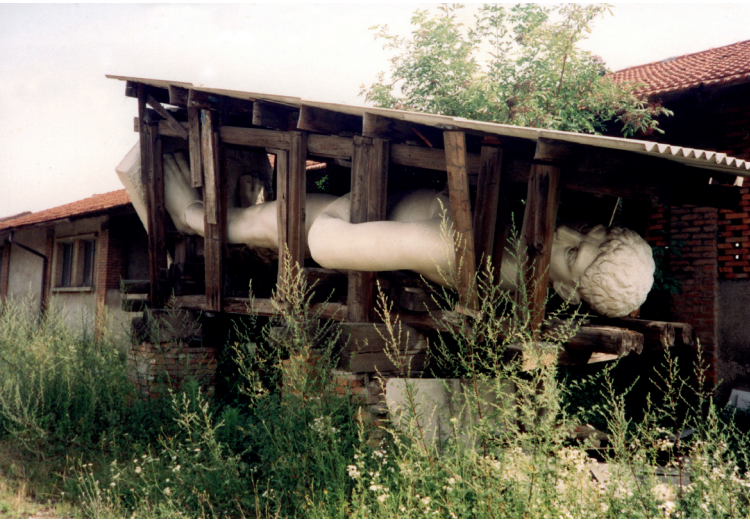
Figura 7.2 Il 'Bigio', attualmente custodito in un deposito dei Musei di Brescia.

to conferma quanto affermato da Ruth Ben-Ghiat (2017), vale a dire che i monumenti inneggianti al fascismo in Italia evocano l'ideologia del regime e sono pertanto parte di questa ingombrante eredità. Il dibattito è stato acceso, finché la successiva giunta di centro-sinistra ha bloccato il progetto.