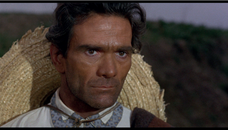
Figura 3.2 Inquadratura tratta dal film Requiescant (1967) di Carlo Lizzani. Pier Paolo Pasolini nei panni di un prete messicano

senso poiché questo film è il risultato di una complessa operazione di ibridazione culturale. Secondo Raffaele Moro (2013, 151), questo è un film anomalo che convoglia un messaggio rivoluzionario ma pacifista nel contempo e commistiona scene di violenza ad elementi picareschi.