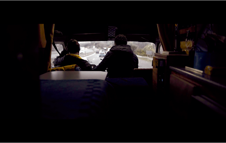
Figura 6.1 Inquadratura tratta dal film Talien di Elia Moutamid (2018). La camera si allontana dai protagonisti quando parlano di eventi dolorosi

intensa attività imprenditoriale ha contribuito in maniera negativa alla salute della moglie, che soffre di depressione. Aldo inizia a parlare di questo tema in arabo, ma la conversazione finisce in italiano quando Elia interroga il padre riguardo alla sua decisione di partire chiedendogli: «E la mamma cosa farà adesso?». Se le lingue in comune costituiscono un elemento di unione tra padre e figlio, il repentino cambio di lingua in questa scena segnala un disaccordo tra i due.