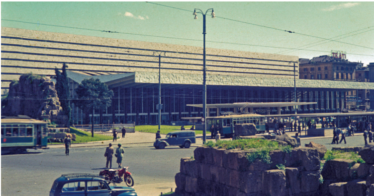
Figura 2.1 Stazione Termini nel 1956. L'esterno della stazione nella sua configurazione attuale.

utopias crystallize in realized form» (come agli antipodi dell'utopia, essendo quest'ultima immaginaria, mentre le eterotopie sono disposizioni reali, cioè il modo in cui le utopie si cristallizzano nella loro forma realizzata) (Foucault 2008, 25, commento dei traduttori).