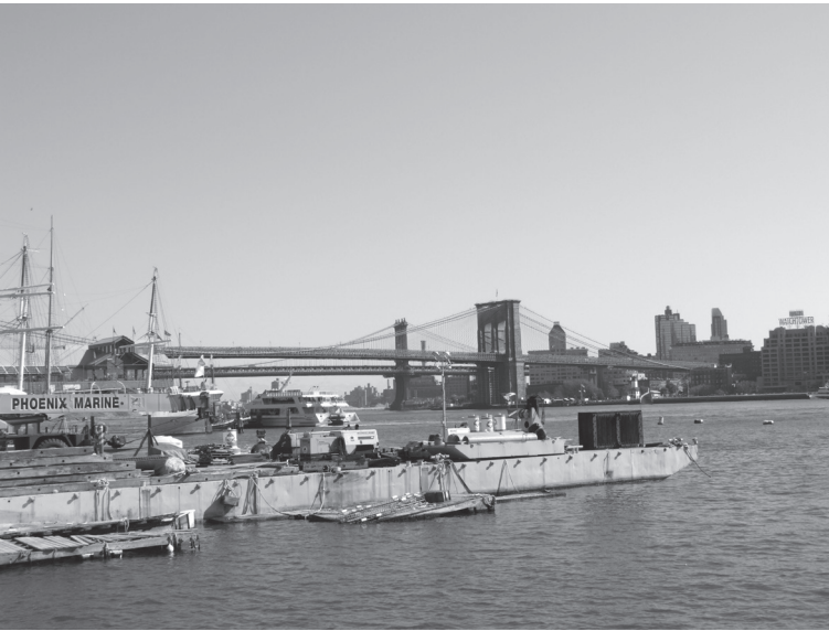
Figura 1.2 Inquadratura tratta da Vue du Pont di Sidney Lumet (1962). Il ponte di Brooklyn visto da Red Hook

possono iniziare o stroncare carriere. Sua sorella Susan (Susan Harrison) ha un rapporto morboso con il giornalista, e quando ella accenna all'idea di sposarsi con un giovane musicista, Steve Dallas (Martin Milner), J.J. incarica Falco di costruire uno scandalo che distrugga il musicista. J.J. si rende conto ben presto che così facendo potrebbe perdere per sempre la sorella e vuole incastrare Falco, cercando di farlo arrestare da un poliziotto che lavora per lui. Falco riesce a sfuggirgli proprio salendo sul Queensboro Bridge. In questo caso, salire su un ponte vuol dire uscire allo scoperto. Il movimento dal basso verso l'alto di questo personaggio italiano americano segnala che le sue losche attività sono invisibili solo nella misura in cui non sono esposte dalla stampa. J.J. non fa un 'lavoro sporco' come Falco; ciononostante è capace di costringere le sue vittime a comportarsi come egli desidera.