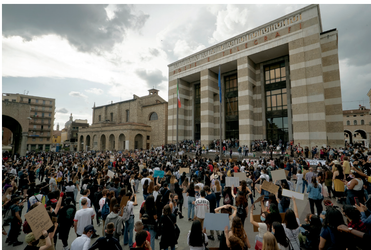
Figura 7.3 Inquadratura tratta da Oltre i bordi di Simone Brioni e Matteo Sandrini (di prossima uscita). La stele realizzata nel 2017 da Mimmo Paladino in Piazza Vittoria a Brescia è visibile a sinistra dell'immagine