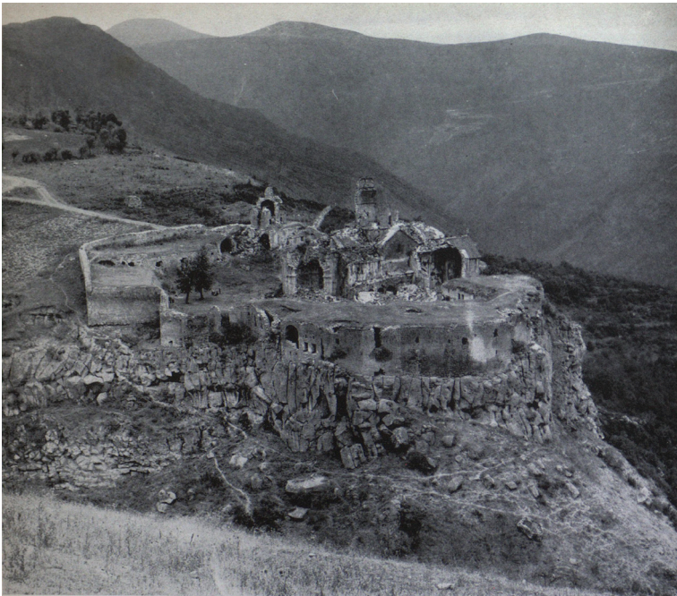
Figura 8 Convento di Tatev, IX-XI secolo, in un'incisione da G. Alishan, Sisakan, Venezia 1893. Da Architettura medievale armena