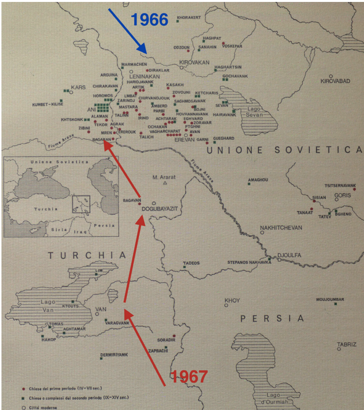
Figura 1 Turchia orientale e Caucaso meridionale, mappa con indicazione dei percorsi seguiti durante le missioni di studio della Sapienza 1966-67. Elaborazione da Architettura medievale armena , 1968

Tenuto conto di tali esplorazioni storiche, che avevano prodotto una notevole bibliografia, l'indagine sul campo in quei territori non era un'esperienza essenzialmente nuova e - va detto subito - non fu neppure unica in quanto tale, giacché missioni scientifiche nel Vicino Oriente venivano condotte in quel tempo anche da altri studiosi, sia stranieri che italiani. Tra questi ultimi, si ricorda che negli stessi anni anche un gruppo di ricerca del Politecnico di Milano, coordinato da Adriano Alpagò Novello, si rivolgeva al Caucaso e si apprestava a compiere viaggi di studio che contribuirono grandemente alla conoscenza dell'architettura armena attraverso pubblicazioni ed eventi espositivi.