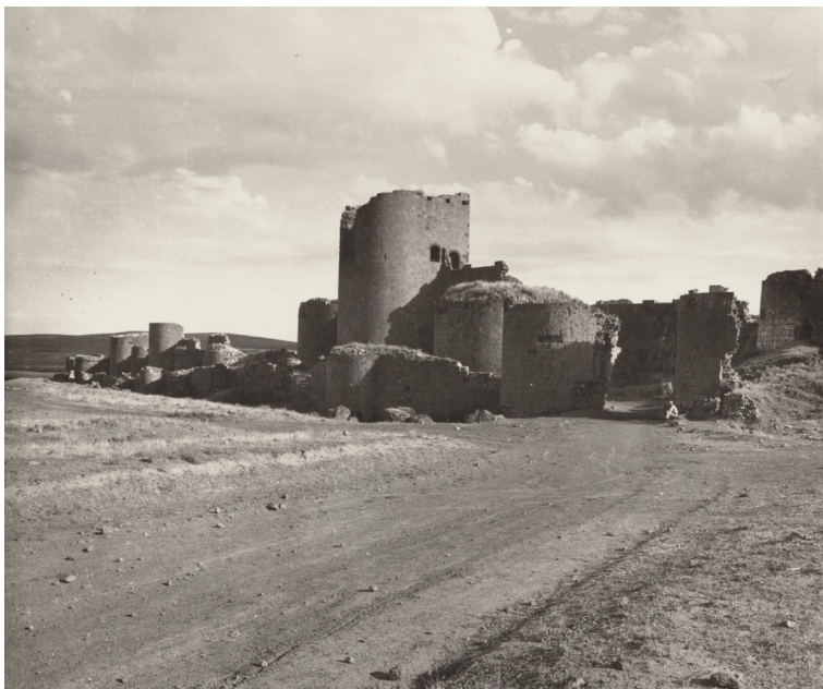
Figura 2 Ani, mura. Ca. 1967.

ai manufatti architettonici databili tra il IV e il XIV secolo. Essi consistevano per lo più in complessi religiosi (di numero complessivo certamente più consistente), ma accanto a questi figurano anche capolavori dell'architettura civile - ricordiamo ad esempio lo straordinario materiale fotografico relativo alle mura di Ani [fig. 2] o alla cittadella di Kars.