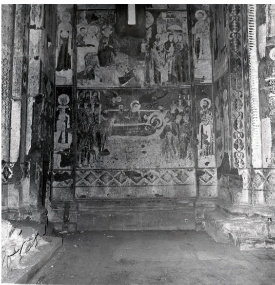
Figura 3 Ani, chiesa di San Gregorio di Tigran Honents, XIII secolo. Dettaglio della decorazione scultorea. Ca. 1967.