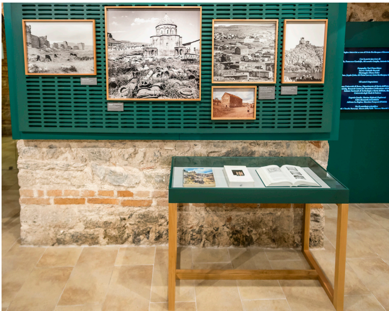
Figure 14-15 Istanbul, Koç University, ANAMED. Mostra fotografica Picturing a Lost Empire: An Italian Lens on Byzantine Art in Anatolia, 1960-2000.