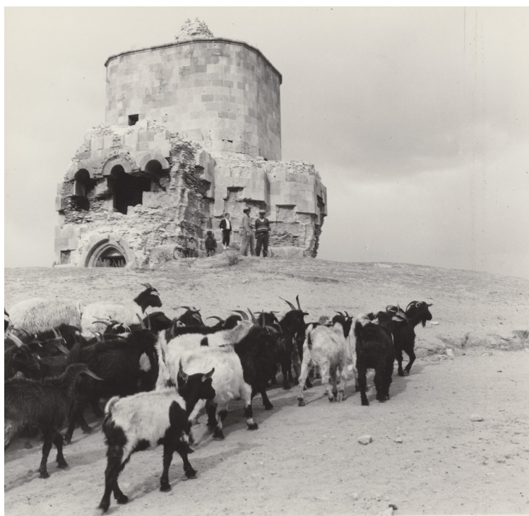
Figura 6 Kars, chiesa detta Beşik Camii, XI secolo. 1967.