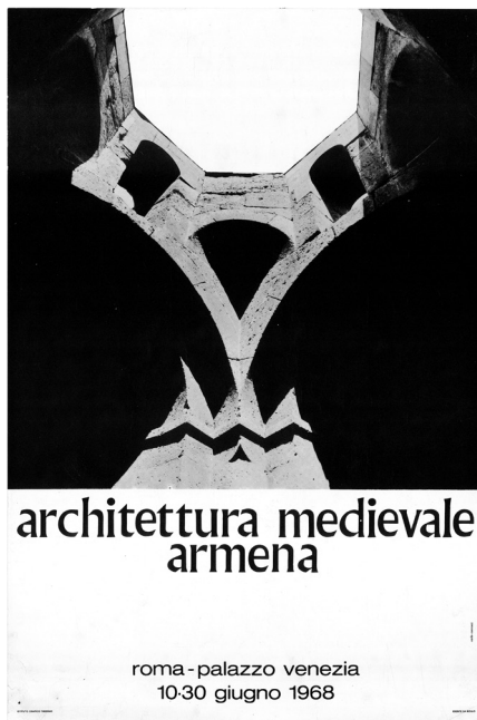
Figura 10 Locandina della mostra Architettura medievale armena , Roma 1968

Il bagaglio di fotografie storiche eseguite dai passati esploratori, la conoscenza puntuale dei disegni e delle incisioni pubblicate dai viaggiatori che avevano preceduto i nostri studiosi forniva loro già una prima 'lente' attraverso cui avvicinarsi all'osservazione di ciascun monumento. Ciò è evidente nel tentativo di ritrarre, ogni qualvolta fosse possibile, gli stessi edifici dallo stesso punto di vista degli antichi osservatori dando così l'esatta misura di ogni cambiamento, piccolo o grande, intervenuto nel tempo. Macroscopico il caso del convento di Tatev, ritratto in un'incisione pubblicata nell'opera di Ghevond Alichan del 1893 nel suo complesso ancora intatto e funzionante, ma che le fotografie della missione degli anni Sessanta mostrano pesantemente danneggiato a causa del terremoto del 1931 [figg. 8-9]. Si dava così modo di riflettere con nuova coscienza sul valore della ricerca scientifica come elemento della storia di un monumento. In altre parole, la consapevolezza che l'esser stato fatto oggetto di indagine in un determinato modo e in un dato momento storico, ciò stesso fa parte della vita dell'opera d'arte, giacché ogni nuovo studio, costruito sulle fondamenta di quelli precedenti, non solo ne approfondisce la conoscenza, ma finisce per cambiarne sensibilmente la percezione.