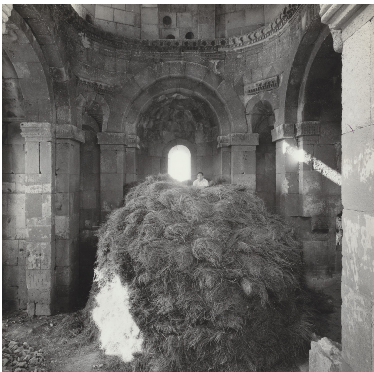
Figura 5 Soradir, chiesa di Sant'Etchmiadzin, VI-VII secolo. Interno, 1967.

L'uso estensivo della fotografia fu strumento essenziale per la raccolta di documentazione che fu sin dall'inizio uno degli scopi primari delle spedizioni scientifiche. Gli scatti venivano realizzati da tutti i punti di osservazione possibili, a volte sfruttando persino occasioni estemporanee, come nel singolare caso della chiesa di Soradir, all'epoca usata dai contadini locali come pagliaio, circostanza che si rivelò a Paolo Cuneo inaspettatamente utile per fotografarne da vicino dettagli dell'ornamentazione interna alla base della cupola nonché per apprezzarne la planimetria da un punto di osservazione elevato [fig. 5]. 19 Le foto restituiscono così anche immagini dei monumenti, per così dire, 'abitate' dalla vita quotidiana di cui erano divenute parte, catturando nell'obiettivo la testimonianza preziosa di un anno, un giorno, un secondo irripetibili [figg. 6-7].