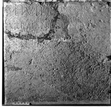
Figura 6 Mausoleo di Augusto, urna di Livilla. CIL VI 891 (Pancierera 1994, nr. XXV)

Livilla, [M(arci) Vinici (scil. uxor)], Germanici Ca[esaris f(ilia)], hic sita e[st]. 694