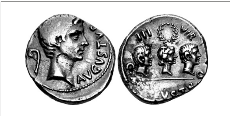
Figura 3 Denario di Augusto (RIC I 404)