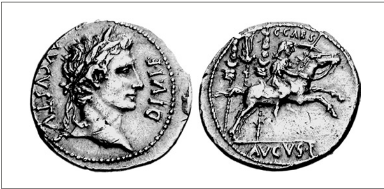
Figura 2 Aureo di Augusto (RIC I 198)

campagne militari, per motivi di sicurezza, nel vivo delle azioni militari, fosse stata lasciata presso il padre e con lui avesse fatto rientro a Roma. 111 In questo caso il ruolo assunto da Livia nel corso dei festeggiamenti in onore di Tiberio sarebbe stato in un certo senso quello di 'sostituta' della nuora in quanto madre dell'imperatore, moglie del principe e rappresentante più autorevole dell' ordo matronarum . La possibile presenza di Giulia a seguito del padre e del marito presso le legioni stanziato sul confine renano si evidenzia quale elemento di notevole importanza: l'ultima campagna militare condotta dal principe dovette avere lo scopo di presentare alle truppe gli eredi in ottica di affermazione dinastica. Se la presenza della figlia di Augusto nell'area risulta ipotetica, la presentazione di Gaio Cesare alle truppe sarebbe attestata, infatti, da un'emissione monetale della zecca di Lugdunum che, al rovescio, presenta il nipote di Augusto a cavallo mentre tiene nella mano destra una lancia e galoppa verso destra lasciando alle sue spalle una serie di tre insegne militari. I denari e gli aurei che presentano questa scena sono stati datati dalla critica moderna all'8 a.C. e il loro messaggio iconografico sarebbe stato rivolto proprio alle truppe alle quali il giovane erede del principe era stato in questa occasione presentato ufficialmente. 112