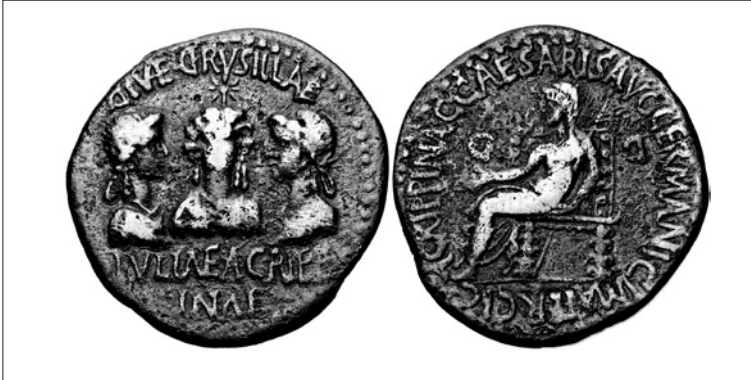
Figura 5 Asse di Caligola (RPC 2012)

elementi non è mai attestato dalla tradizione: nelle iscrizioni pubbliche e sulle emissioni monetali, databili quasi esclusivamente al principato di Caligola e alle fasi iniziali di quello di Claudio, la terza figlia di Agrippina e Germanico è sempre chiamata Giulia. 690 Ciò appare evidente soprattutto nelle serie monetali che ritraggono insieme le tre sorelle di Caligola: per le sorelle maggiori l'elemento derivato dal gentilizio Iulius è omesso a favore di cognomina alla forma femminile (Agrippina e Drusilla): la figlia minore viene contraddistinta, invece, dall'elemento comune alle tre donne, Giulia.