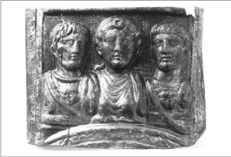
Figura 4 Bonn, Rheinisches Landesmuseum , cat. 4320 (Kuttner 1995, pl. 114)

La diffusione di tali temi iconografici che enfatizzano la dimensione dinastica sarebbe confermata in questa zona area dal ritrovamento di una placca di bronzo, pertinente probabilmente a un fodero di spada o a un'armatura militare, conservata al museo di Bonn, di provenienza ignota ma sicuramente ascrivibile all'area del Reno occupata dalle truppe romane, sulla quale sono rappresentati frontalmente due giovani con corazza e al centro una donna.