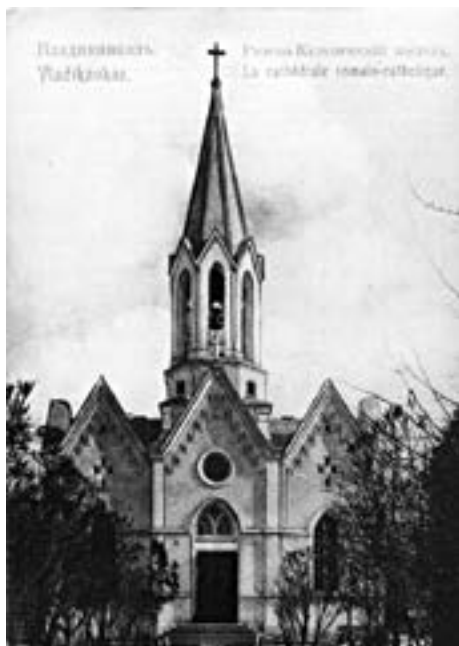
Рисунок 6. Католический храм св. Антония Падуанского (1891 г.). Фото начала XX в