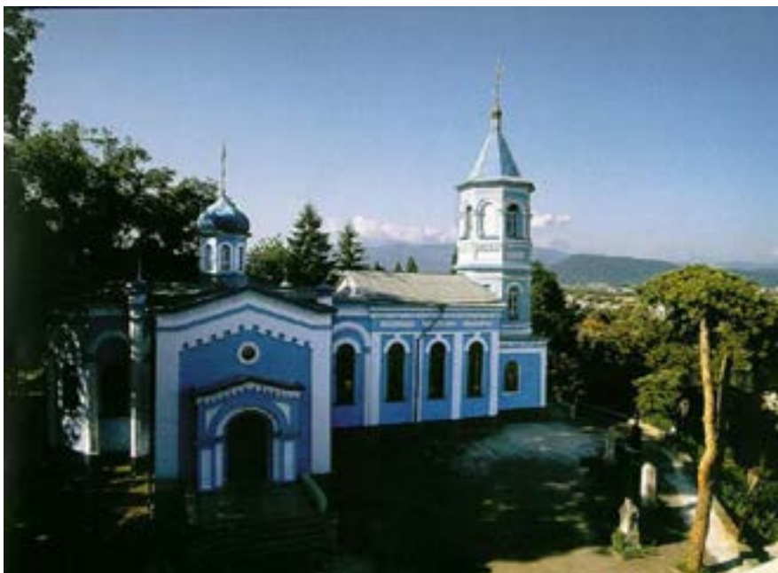
Рисунок 3. Церковь Рождества Пресвятой Богородицы «Осетинская церковь» (1815 г.). Фото 2016 г