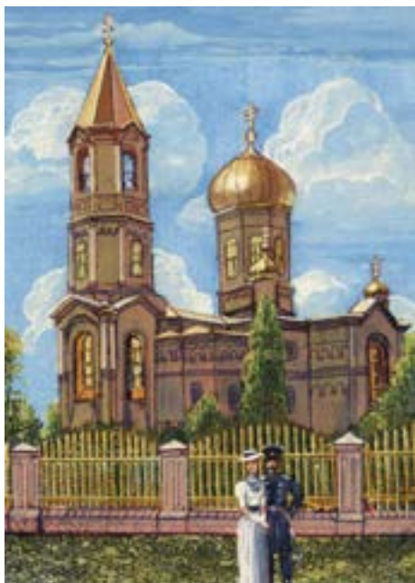
Рисунок 5. Храм Успенья Богородицы (Греческая церковь) (1902 г.). Открытка начала XX в