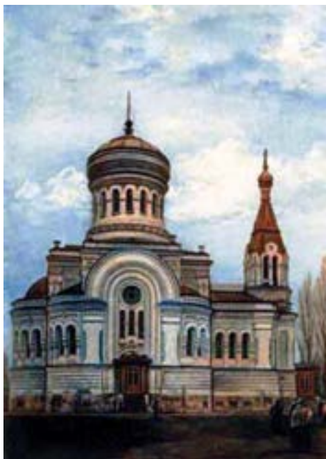
Рисунок 1. Кафедральный собор в честь Михаила Архангела («Новый собор») (1872-1894 гг.). Раскрашенное фото начала XX в