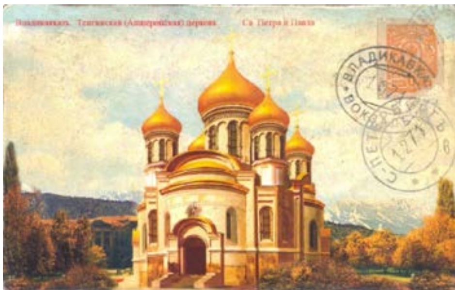
Рисунок 2. Церковь во имя Святых Петра и Павла (Апшеронская церковь) (середина XIX в.). Открытка начала XX в