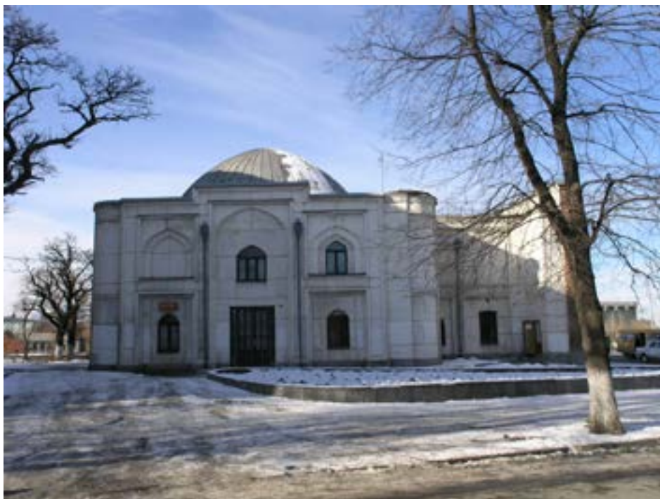
Рисунок 8. Шиитская мечеть (1870 гг.). Фото 2016 г