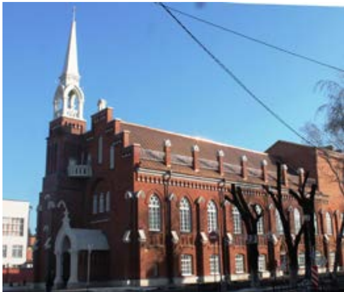
Рисунок 7. Евангелическо-лютеранский молитвенный дом (кирха) (1866 г.). Фото 2016 г