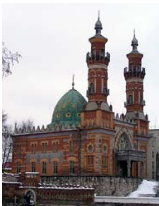
Рисунок 9. Суннитская мечеть (1908 г.). Фото 2016 г