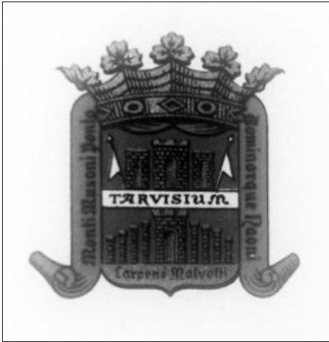
Figura 12. Marchio di fabbrica Carpenè Malvolti.

successo all'Esposizione italiana di belle arti a Londra nel 1888. 22 Già nel 1882 il famoso agronomo Ottavio Ottavi affermava nel suo trattato di enologia che «dopo l'invenzione dell'apparecchio Carpenè noi non crediamo più consigliabile la fabbricazione dei vini spumanti col metodo dello Champagne: questo metodo è lungo, minuzioso, costoso, di difficile attuazione, e quasi nessuno riuscì bene con esso in Italia. Conosciamo tutti i vini spumanti posti in commercio da noi in questi venti anni, ma ben pochi possono gareggiare coi vini spumanti alla Carpenè od alla Sciampagna». 23