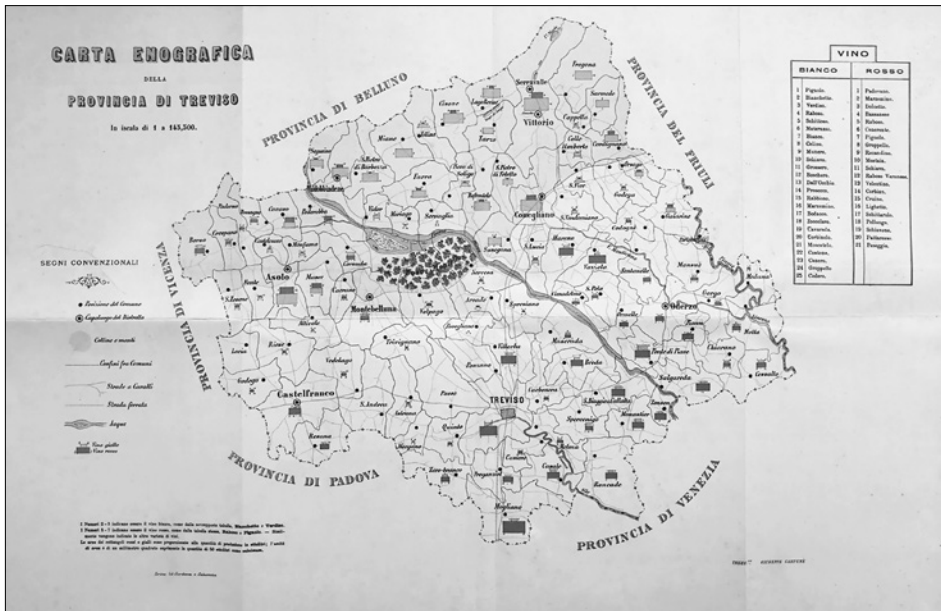
Figura 3. Carta enografica della provincia di Treviso nel 1874. Fonte: A. Carpenè e A. Vianello, La vite ed il vino nella provincia di Treviso

tura, all'interno della quale per la prima volta proponeva l'istituzione di una scuola di enologia con sede a Conegliano. Collaborò all' Enciclopedia agraria italiana (Torino 1871-1880), curando diverse voci concernenti la disciplina vitienologica, e pubblicò nel 1871 la prima edizione del Sunto teorico e pratico di enologia , 30 adottato anche come testo scolastico tra le due guerre mondiali. 31 In occasione dell'Esposizione Universale di Vienna del 1873 presentò in anteprima, assieme ai vini prodotti dalla Società, la monografia La vite e il vino nella provincia di Treviso , scritta con Angelo Vianello, riscuotendo un successo tale che il Ministero lo nominò delegato ufficiale alla successiva Esposizione Universale di Parigi nel 1878, cui prese parte nonostante proprio in quell'anno il governo della Sinistra storica avesse abolito il Ministero dell'Agricoltura, per ricostituirlo peraltro