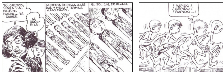
Figuras 4 y 5. Paracuellos 1 y Paracuellos 2 (Giménez 2012, 57, 156)

cárceles. Estos menores, por lo tanto, eran, mayormente, hijos de rojos y como tal se les trataba. Una de las primeras medidas tomadas por el régimen de Franco fue la reforma de la educación, había que borrar todo vestigio de los avances pedagógicos, liberales y ateos de la República. Con las nuevas leyes 11 se otorgó mayor poder a la Iglesia, que pasó a regular activamente la enseñanza. Se promovió la discriminación por sexos y por élite , de manera que se configuró una doble vía de educación, la de las clases pudientes, adeptas al régimen, y la de los más desfavorecidos. Para estos últimos el plan de estudio estuvo destinado a la transformación ideológica de los hijos de los vencidos. El máximo exponente fueron los niños del Auxilio Social. De ahí que en el prólogo de Paracuellos Antonio Martín hable de una «guerra de ideas, guerra política, guerra social, guerra de clases» (2000, 3).