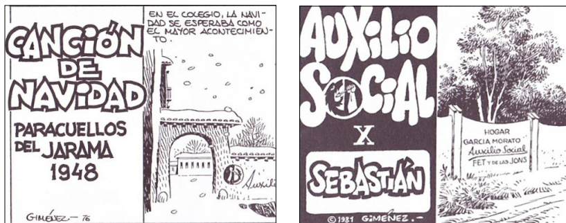
Figuras 1 y 2. Paracuellos 1 y Paracuellos 2 (Giménez 2012, 64, 180)

de Paracuellos coinciden en imágenes que evocan la devastación y la imposibilidad de olvidar: «el infierno de la memoria» (Jesús Cuadrado), «la huella infinita» (José María Beá).