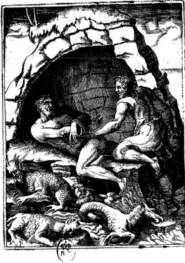
Figura 3 Achille Bocchi, Symbolicarvm qvaestionvm, De vniuerso genere, quas serio ludebat, libri qvinque. , Bononiae, In aedib. nouae Academiae Bocchianae, 1555, 124

CXXIII LIB. SECVND. DIVAERENATAE FERRARIAE, AC CARNVTI PRINCIPI ILLVSTRIS. GALL. REG. LVDO. XII. F. VNAM VIDENDAM VERITATEM IN OMNIB. SYMB. LX.