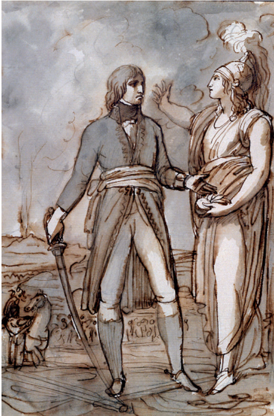
Figura 3 Andrea Appiani, Napoleone riceve, appena varcate le Alpi, il pomo della vittoria da Minerva. 1796. Penna a inchiostro bruno, biacca e acquerello su carta. Collezione privata.