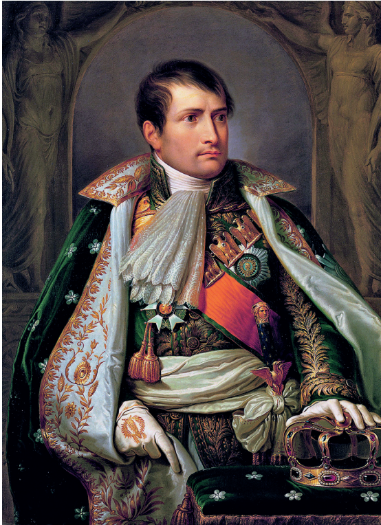
Figura 10 Andrea Appiani, Ritratto a tre quarti di Napoleone 'en petit habillement' di re d'Italia . 1805. Olio su tela. Vienna, Kunsthistorisches Museum, Schatzkammer. Archivio dell'autore