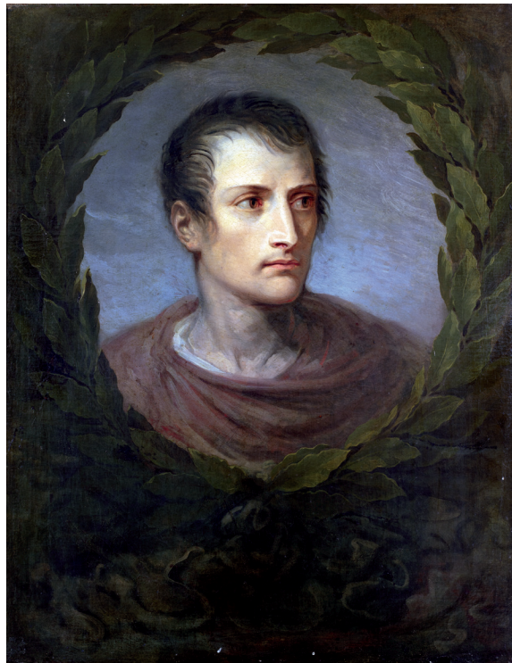
Figura 4 Andrea Appiani, Ritratto a tre quarti di Napoleone primo console . 1801. Olio su tela. L'Avana (Cuba), Museo Napoleónico.