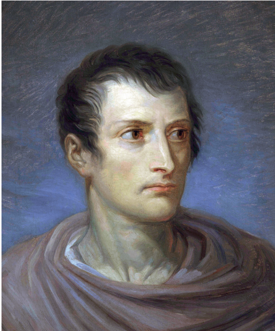
Figura 8 Andrea Appiani, Ritratto di Napoleone all'antica . 1802. Olio su tela. Collezione privata.

senza la corona d'alloro [fig. 8], 14 è legata cronologicamente alla vicenda del concorso della Riconoscenza della Repubblica italiana a Napoleone bandito a Milano nel 1801 per esprimere gratitudine al generale liberatore con un dipinto di grandi dimensioni da collocare nel Foro Bonaparte, progettato da Giovanni Antonio Antolini a partire dal 1801 e rimasto poi irrealizzato. 15 Il bando de Il Redattore Cisalpino precisava che il concorso nazionale era stato indetto per un dipinto di vaste dimensioni che avrebbe dovuto rappresentare la riconoscenza verso Napoleone, esempio