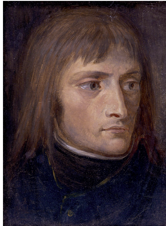
Figura 2 Andrea Appiani, Ritratto di Napoleone . 1796. Olio su tavoletta. Milano, Pinacoteca Ambrosiana.

Dopo questa vicenda, dopo il rientro degli austriaci a Milano il 28 aprile del 1799 e il definitivo avvento di Bonaparte a seguito della vittoria di Marengo del 14 giugno 1800, Appiani si trovò nuovamente a raffigurare Napoleone dal vero nella seconda metà del 1801, quando soggiornò a Parigi per qualche mese. 9 Va collocata nell'arco