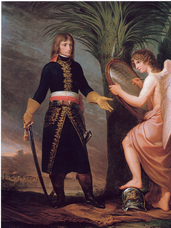
Figura 1 Andrea Appiani, Napoleone con il Genio della Vittoria che incide le imprese della battaglia del ponte di Lodi . 1796. Olio su tela. Inghilterra, Dalmeny House, ex collezione Earl of Rosebery, collezione Primrose.

potere, mentre Napoleone e il suo entourage capirono immediatamente che il talento, la maestria e la velocità di questo pittore avrebbero potuto essere elementi decisivi per dare vita ai simboli, alle allegorie, ai traslati celebrativi di un potere nuovo e privo di tradizione. Infatti tra i primi incarichi ottenuti dal nuovo governo, in un'ottica profondamente innovatrice di ricerca di consenso e di capillare diffusione di nuovi traslati allegorici, vi fu quello di realizzare i disegni delle medaglie celebrative delle vittorie o delle ricorrenze della Repubblica, delle intestazioni (molte, ritagliate, si conservano presso la Civica Raccolta Bertarelli e nella collezione dell'ambasciatore