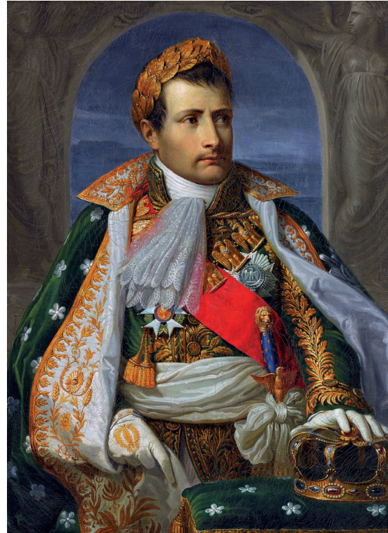
Figura 11 Andrea Appiani, Ritratto a tre quarti di Napoleone 'en petit habillement' di re d'Italia con corona imperiale . 1805. Olio su tela. Île d'Aix, Musée Napoléon

Tra i tre di maggiori dimensioni dobbiamo includere il prototipo del Ritratto a tre quarti di Napoleone in 'petit habillement' di re d'Italia , oggi alla Schatzkammer del Kunsthistorisches Museum di Vienna e proveniente dal Palazzo Reale di Milano, con mantello di velluto verde ricamato con quadrifogli dorati e risvolti di seta bianca ricamati d'oro e con due allegorie della Vittoria sullo sfondo [fig. 10], e quello del Ritratto a tre quarti di Napoleone in 'petit habillement' di re d'Italia , al Musée Napoleon di Île d'Aix, con lo stesso abito cerimoniale e con lo stesso sfondo ma, diversamente dall'altro, con la corona imperiale a foglie d'oro sul capo [fig. 11].