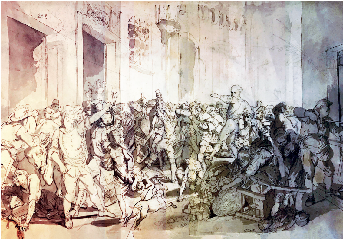
Figura 6 Francesco Gandolfi, Il Balilla . 1851. Matita nera, penna e inchiostro, pennello e inchiostro acquerellato su carta bianca, 349 × 461 mm. Genova, Gabinetto Disegni e Stampe di Palazzo Rosso, inv. D6676. © Autore

rolamo Induno nella decorazione delle due sale d'aspetto del medesimo edificio creano le allegorie di Firenze, Roma, Venezia e Napoli attraverso una maggiore semplicità compositiva e chiarezza di linguaggio al pari del nostro Gandolfi. 10 Nei progetti per la stazione genovese affiora infatti una maggiore esigenza di concretezza storica in un'immagine che parte dalla tradizione pittorica dei secoli precedenti ma con un linguaggio più diretto.