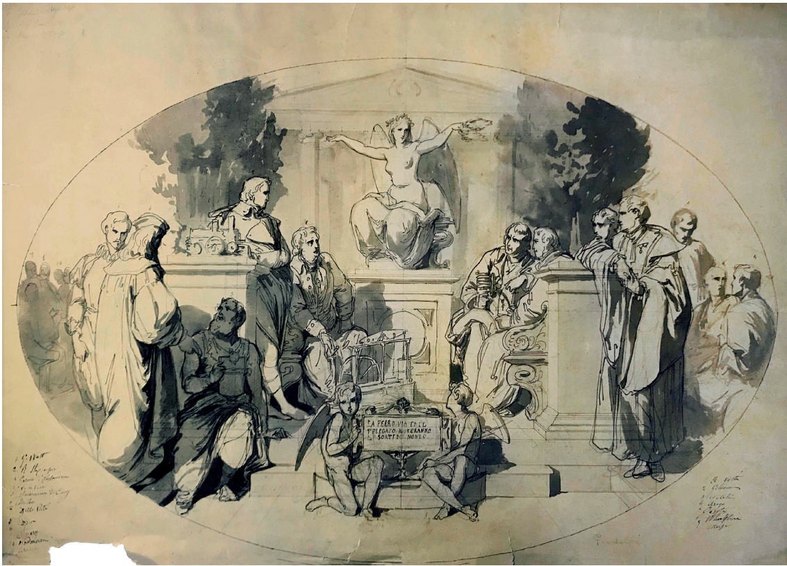
Figura 5 Francesco Gandolfi, Allegoria del telegrafo e della ferrovia . 1859-60. Matita nera, penna e inchiostro, pennello e inchiostro acquerellato su carta bianca, 475 x 681 mm. Genova, Gabinetto Disegni e Stampe di Palazzo Rosso, inv. D6677.

dagli anni Cinquanta, tra cui i lavori di costruzione della linea ferroviaria Torino-Genova, avevano rafforzato nel capoluogo ligure il ceto medio, facendo emergere una nuova borghesia degli affari e delle professioni: la composizione di Gandolfi, celebrando non tanto concetti astratti ma scoperte e invenzioni che avevano trovato un'applicazione concreta in campo tecnologico, assume pertanto la valenza di un vero e proprio manifesto degli ideali di progresso della nuova classe egemone genovese, ideata per un luogo, la stazione ferroviaria, centrale nello sviluppo della città. La ferrovia stava infatti rivoluzionando il sistema dei trasporti permettendo a Genova di integrarsi in dinamiche di mercato ben più ampie (Doria 2007).