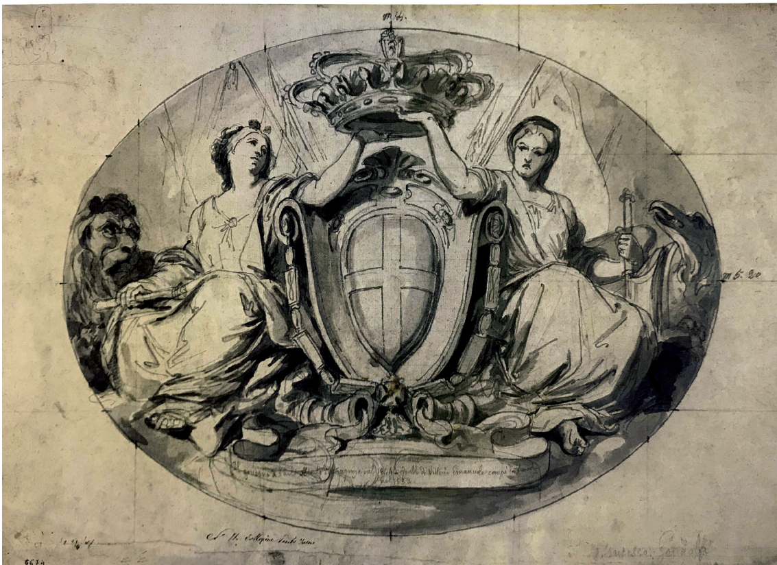
Figura 3 Francesco Gandolfi, Allegoria del telegrafo e della ferrovia . 1859-60. Matita nera, penna e inchiostro, pennello e inchiostro acquerellato su carta bianca, 485 × 636 mm. Genova, Gabinetto Disegni e Stampe di Palazzo Rosso, inv. D6676.