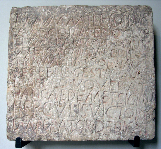
Fig. 1 © Olga Lyubimova, 2009 (Città del Vaticano, Musei Vaticani, Museo Pio Clementino, Gabinetto dell'Apoxyomenos, inv. 1158). https://ancientrome.ru/art/artworken/img.htm?id=3634

En 1998, environ 75% de ce matériau des épigrammes en pierre (de tailles, de formes, de matériaux et de qualités différents) de Rome encore conservées a été collecté par le savant suédois Bengt E. Thomasson comme étude préparatoire pour un volume du CIL , jamais publié. 16 Ces études préliminaires approfondies et ces recherches précises ont maintenant trouvé une personne disposée à les poursuivre. Malgré le grand nombre et la grande diversité des épigrammes dans la ville de Rome en ce qui concerne les couches sociales représentées, le contenu et le niveau linguistique, cette pré-collecte « thomassonienne » des inscriptions romaines en vers sur pierre garantit qu'une édition pourra être présentée à ce sujet en 2026. L'analyse régionale sera abordée dans le commentaire. Plus important encore, le travail sur l'édition de la ville de Rome fournira une base essentielle pour les discussions au sein de notre équipe de doctorants et donnera matière à des études comparatives de tous les autres projets.