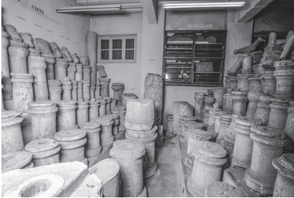
Figure 1 Cippes funéraires inscrits de la période hellénistique et romaine. Musée archéologique de Chypre, Nicosie