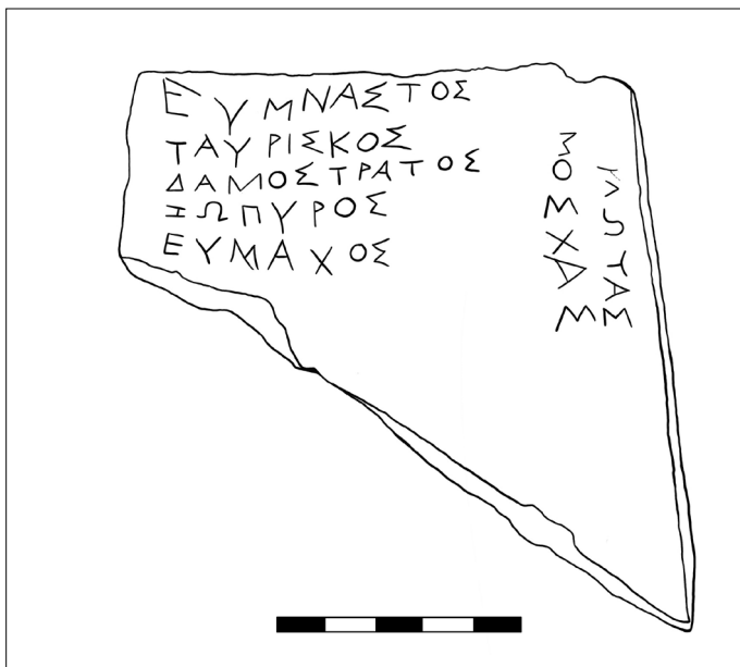
Figura 1 Museo Archeologico Nazionale di Taranto, tegola di terracotta con nr. inv. 220167