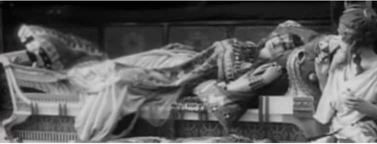
Figura 7 Fotogramma dal film Cabiria (1914)