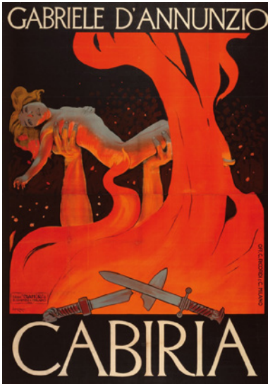
Figura 4 Leopoldo Mettcoritz. Manifesto per il film Cabiria (1914). Collezione Museo Nazionale del Cinema

manità peccatrice [fig. 4]. Dalla terra uscita, quella bestia immane sembra che sia destinata a ritornare alla terra e in essa rinchiudersi definitivamente, conclusasi l'impresa missionaria, e conservarsi, per riaffiorare in altri momenti, altrettanto tragici, della storia degli uomini. Come non scorgere in tutto questo i segni dell'indicazione di d'Annunzio di intraprendere la 'strada del fantastico' per 'poeticizzare' la cinematografia contemporanea, che, fatte le dovute eccezioni, si era impantanata nella vuota spettacolarità delle immagini magniloquenti o semplicemente comiche e stucchevoli del film muto? I fotogrammi di Cabiria bastano a documentare gli esiti di questa artisticità poetica, raggiunti dalla suggestività delle immagini e dall'atmosfera surreale, magica, sull'indicazione dannunziana, di rivestire dell'alone fantastico la verità della realtà oggettiva.