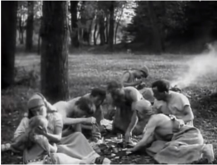
Figura 9 Fotogramma dal film Cabiria (1914)