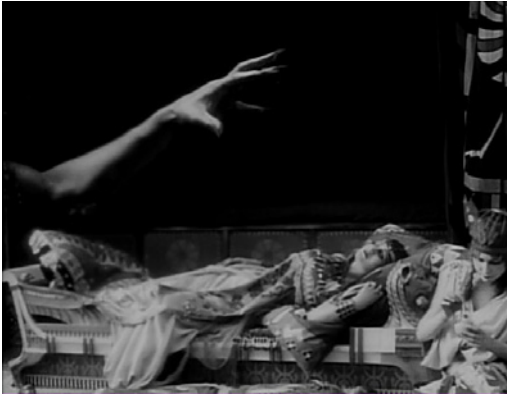
Figura 6 Fotogramma dal film Cabiria (1914)

mente, alla realtà di tutti i giorni, a un brano di verità naturale, l'intenso pathos che sembrava insopportabile e senza via di liberazione.