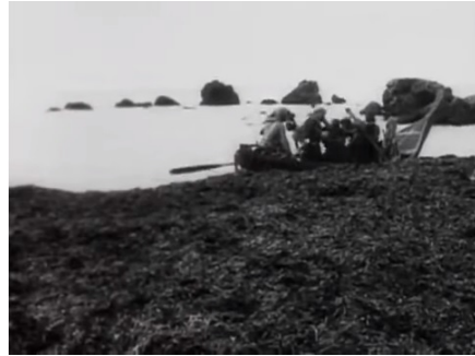
Figura 10 Fotogramma dal film Cabiria (1914)