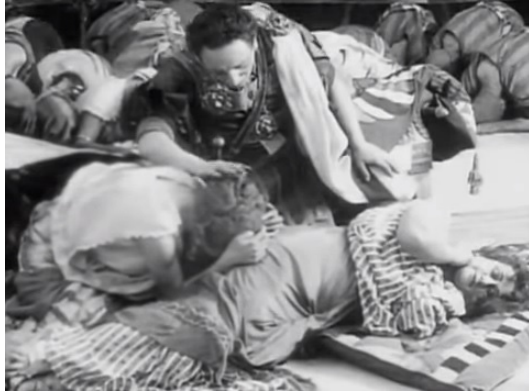
Figura 5 Fotogramma dal film Cabiria (1914)