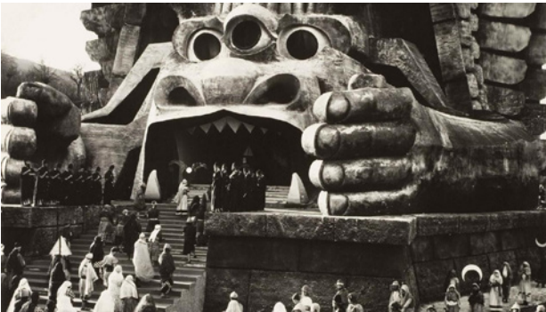
Figura 1 Il dio Moloch