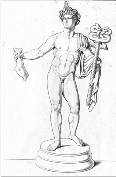
Figure 3. Statuette of Mercury offering a sack of money; drawing after Museo Borbonico 1856 v. 13 tab. 55

A “productive” spell: Take orange beeswax, the juice of the aeria plant and ground ivy and mix them together and fashion a hollow-bottomed Hermes holding in his left hand a herald’s wand and in his right a small bag. Write on an hieratic papyrus these names and you will see unceasing [ i.e. business]: