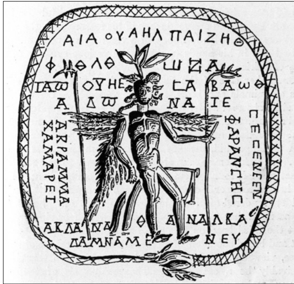
Figure 2. Thunderstone from Ephesus engraved with the Pantheos and magical names surrounded by an ouroboros (Royal Ontario Museum); drawing after Iliffe 1931

have been protection, for example, on a Neolithic axe-head (fig. 2) reused as an amulet in Roman Argos (probably to protect a house from lightning), as well as on a series of lapis-lazuli, hematite and magnetite gems, where he is surrounded by magical words and vowels that often end with the generic command: “protect ( phulaxon ) from evil!” 12 On the earlier and miniature versions of these Pantheos amulets, then, both image and text maintain their focus on protection; there is no talk of prosperity and no need to translate the image by adding the Greek names of Aion or Agathos Daimon to the invocation.