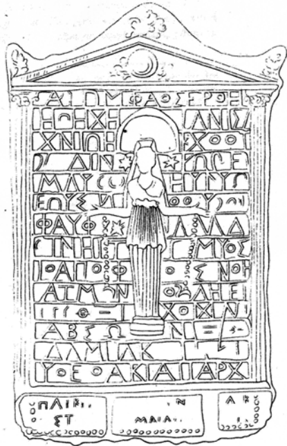
Figure 6. Terracotta plaque of Roman date showing a frontal image of Artemis of Ephesus in a temple with magical words in the background; after Stephani 1850

“Lunar Spell of Claudianus and the Ritual of Heaven and the Big Dipper” which was “found in Aphroditopolis [beside] the greatest goddess Aphrodite Urania, who embraces the universe”. Here, then, we see the combination of Aphrodite-Selene as a cosmic goddess who controls the heavens, something not unexpected in late-antique Egypt, of course, but one sees such a combination already in Theocritus’ second Idyll , where Hecate is summoned to help at the start of an aggressive erotic spell, which is then followed by a plaintive prayer to Selene. 31 Without the drawing missing from the papyrus recipe it is impossible to know how much this clay statue differed from the Argive marble, although the title “Selene the Egyptian” certainly does suggest a non-Greek form of representation. We can say, however, that like this clay statue in its olive-wood shrine, the Argive image (itself depicted in an aedicula ), was probably also the object of some small scale domestic offering like incense.