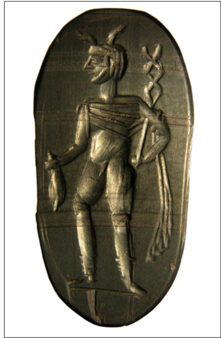
Figure 4. Hematite gem with Mercury and money sack used for prosperity (LIM 406)

shows up frequently on other magical gems ( e.g. SMA nos. 244-47 and BM 149-54), where it probably refers to some solar aspect of Hermes in Late-Antiquity, given the fact that (according to Greek sources at least) baboons “naturally” worshipped the rising sun at dawn by intoning the seven vowels. A unique image on the reverse of a gem in Florence comes close, in fact, to following this recipe: we see Mercury in his usual pose, but holding out the head of a ram instead of a purse, while the baboon reverses him. 21