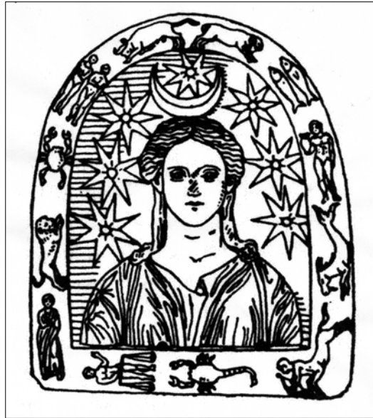
Figure 5. Marble bust of Selene from Argos with hidden magical inscription; drawing after Delatte 1913a

womb of women, Orôriôuth Aubax . Guardian the womb of women, [34 vowels]. Savior the womb of women, Amoun ". 23