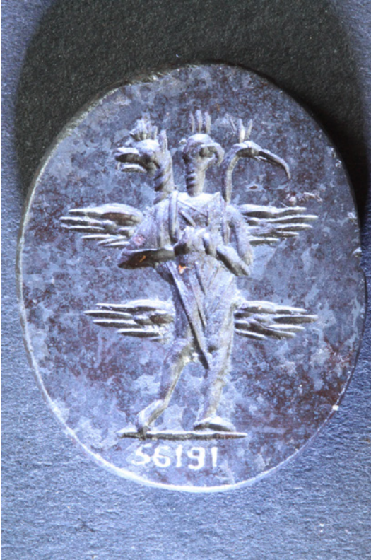
Figure 1. Hematite gem with triple-headed god used for protection (BM 173)

seems, moreover, to be a shorter form of the names that were inserted into the wax statue: Bichô bichô beu beu chôbi chôbi beu soumarta . Unlike the PGM recipe, then, this earlier gemstone, aside from the use of the Greek alphabet, shows no sign of additions or translations, such as the prayer to Aion as “the bringer of wealth” or the Agathos Daimon. The shorter inscription on the gem has, moreover, a very simple form: variations on Horus’ epithet “Great Falcon” followed by the significant word soumarta , which was, in fact, the traditional Greek rendering of the Semitic verb smrt , “protect!”. 11 This short prayer suggests, in fact, that the much longer text in the PGM recipe had grown over the intervening two centuries in such a way as to occlude the originally protective focus of the recipe. In fact, the single-headed version of the Pantheos appears frequently on gemstones of the Roman period and its function, when expressed, seems mainly to